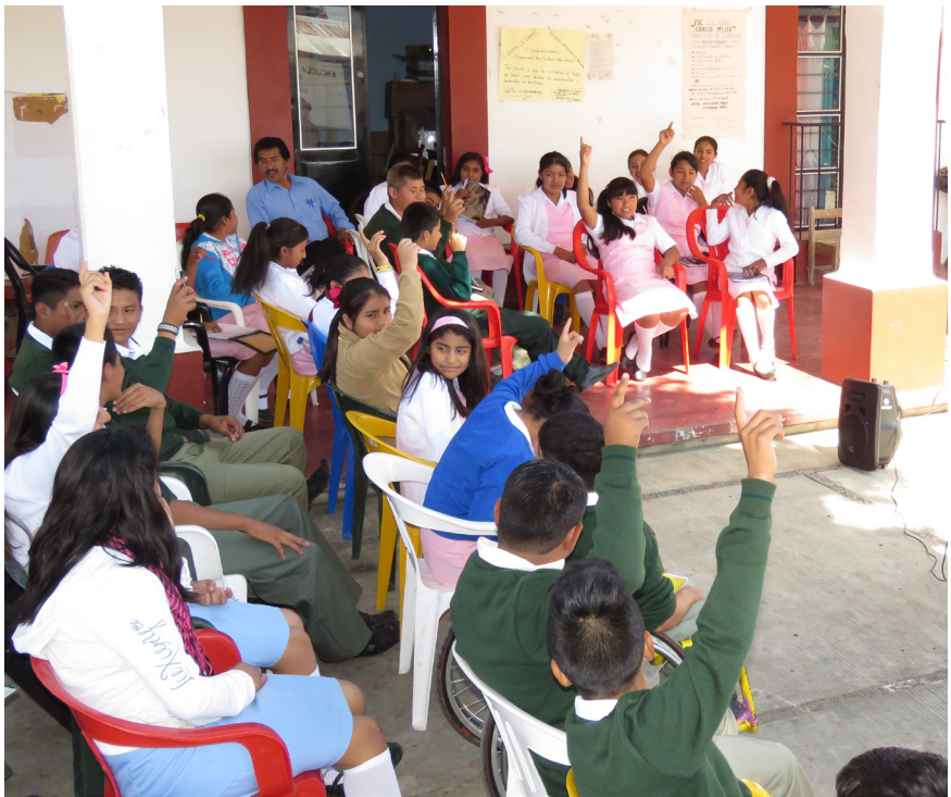
5. "Como realizar una campaña comunitaria", Guía el ABC de la líder comunitaria, entrelazando saberes.